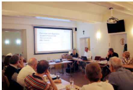
Blick in den Saal während einer Microsoft-Teams-Schulung für die Ehrenamtlichen der Ackermann-Gemeinde in Prag.

Partnerorganisationen beiderseits der Grenze miteinander verbindet. Digitalisierung, Qualifizierung und bessere interne Strukturen sind dabei kein Selbstzweck, sondern schaffen die Grundlage dafür, Begegnungen, gemeinsame Projekte und nachhaltige Kooperationen noch wirksamer zu gestalten. Dass die Ackermann-Gemeinde in diesem Zusammenhang als einer der „Starken Akteure“ gesehen wird, freut uns sehr und ist zugleich Ansporn und Verantwortung.