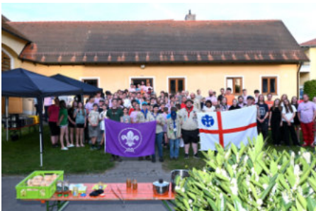
Die Teilnehmerinnen und Teilnehmer der Radtour mit den Pfadfindern aus Wenzenbach und der Abordnung der Ackermann-Gemeinde