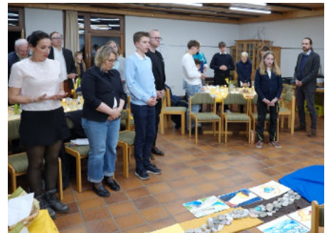
Teilnehmer und Teilnehmerinnen bei der Osterliturgie

chen, sondern man verstecke sich hinter einem technokratischen Argument. Dadurch würden aber teilweise berechtigte Sorgen oder Ängste von vornherein ausgeklammert, was das viel beschworene Totschlängerargument von Verbotskultur und Redeverbot nach sich ziehe. Hier können Bürgerräte eine gute Alternative für einen konstruktiven Austausch der Argumente darstellen. Innerlich unabhängig und parteipolitisch neutral können sich die Räte rein auf das sachliche Argument fokussieren und der betroffenen Kommune eine Empfehlung von außen abgeben.