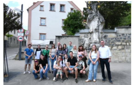
Die Gruppe bei der Statue des Heiligen Johannes Nepomuk in Donaustauf

Auf dem Weg zur zweiten Station, der Walhalla, ging es an der Nepomuk-Statue vorbei – ein Gruppenfoto war hier