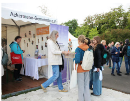
Ehrenamtliche der Ackermann-Gemeinde am Stand unter dem Motto „Mut zur Versöhnung“ (Foto: ag).

Auch die Ackermann-Gemeinde mit der Sdružení Ackermann-Gemeinde und deren Jugendverbänden haben sich aktiv beteiligt. Am Stand stellten sie die aktuellen Jugendangebote sowie Veranstaltungen vor. Der Anziehungspunkt war u. a. das Glücksrad zum Thema „Wie schmeckt Tschechien“. Im Mittelpunkt stand aller-